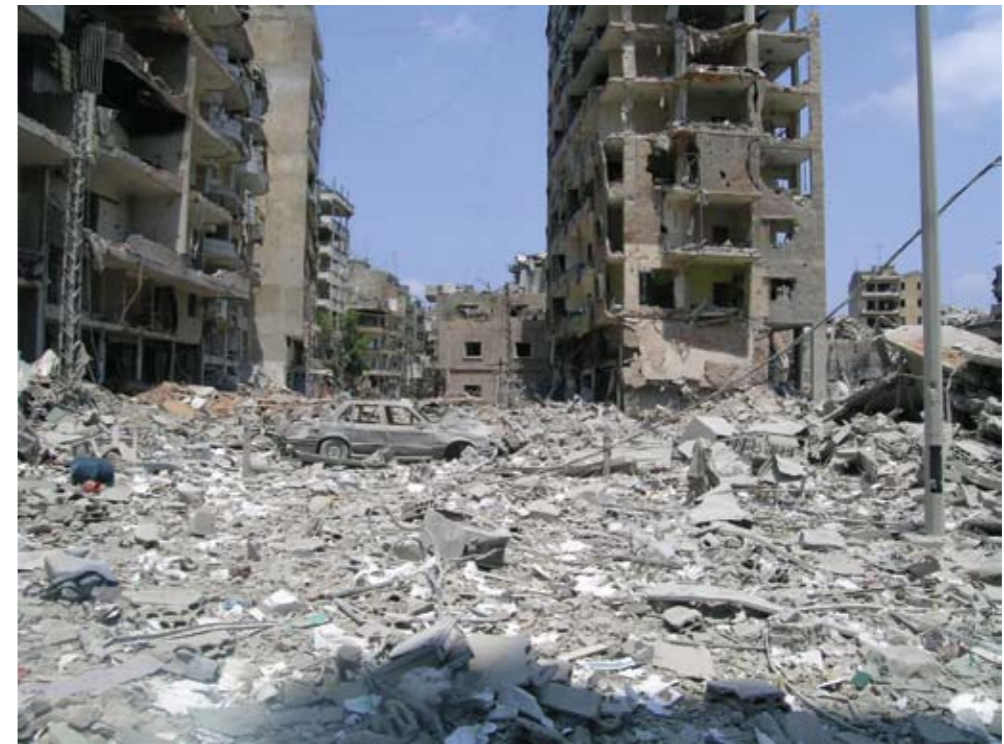
Das Haret Hreik-Viertel nach dem Krieg im Juli 2006

Juli 2010 für die GTZ das Programm zur nachhaltigen Stadtentwicklung in Syrien geleitet.