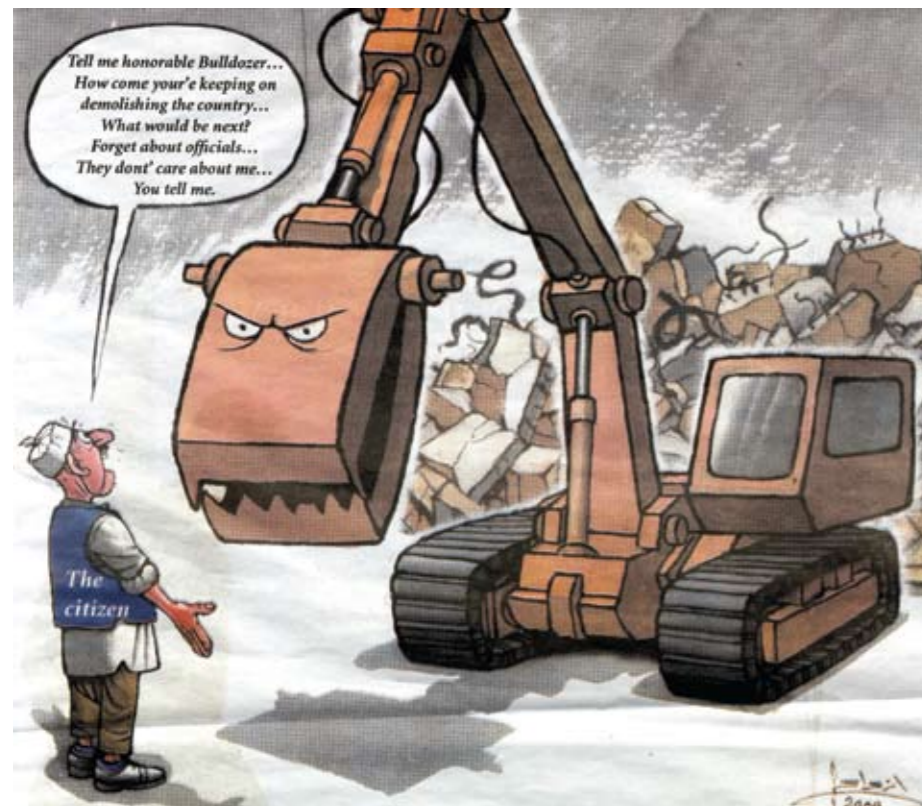
Karikatur zur Diskussion um den Abriss des „Suq al Talata“ © The Tripoli Post

hochhaus, sowie das von DAEWO errichtete zukünftige JW Marriott Hotel.