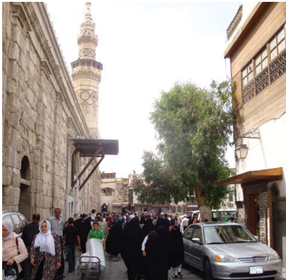
Moderne Herausforderungen für die Altstadt von Damaskus

Im Ergebnis steht, dass die maßgeblichen Ziele, wenn auch mit einer Reihe von Einschränkungen verbunden, erreicht werden konnten. Die Einschränkungen liegen insbesondere in der Problematik, dass die Weiterbearbeitung des Memorandums in Arbeitsgruppen stets einer Tendenz ausgesetzt war, sich in verbaler Argumentation der Teilnehmer zu verlieren. Hier waren überwiegend das Redaktionsteam gefordert, den roten Faden in der Hand zu behalten; überwiegend alle Mitarbeiterinnen und Mitarbeiter von Verwaltungen auf zentraler und lokaler Ebene nicht dazu neigten, schriftlich zu arbeiten; gute Ergebnisse konnten dennoch erzielt werden, wenn sich das Redaktionsteam auf die Dokumentation von Diskussionsergebnissen oder Überarbeitung von Fragmenten und punktuellen Inputs konzentrierte und es auch gegen Ende des Verfahrens noch immer terminologische Unsicherheiten gab; hier behalf sich das Redaktionsteam mit der Zusammenstellung eines umfassenden Glossars auf Englisch und Arabisch im Anhang des Memorandums.