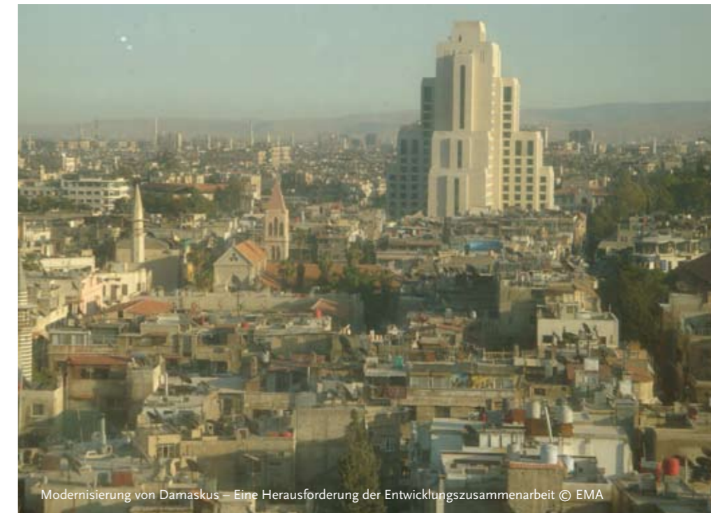
Modernisierung von Damaskus – Eine Herausforderung der Entwicklungszusammenarbeit

für Physische Geographie der Universität Freiburg.