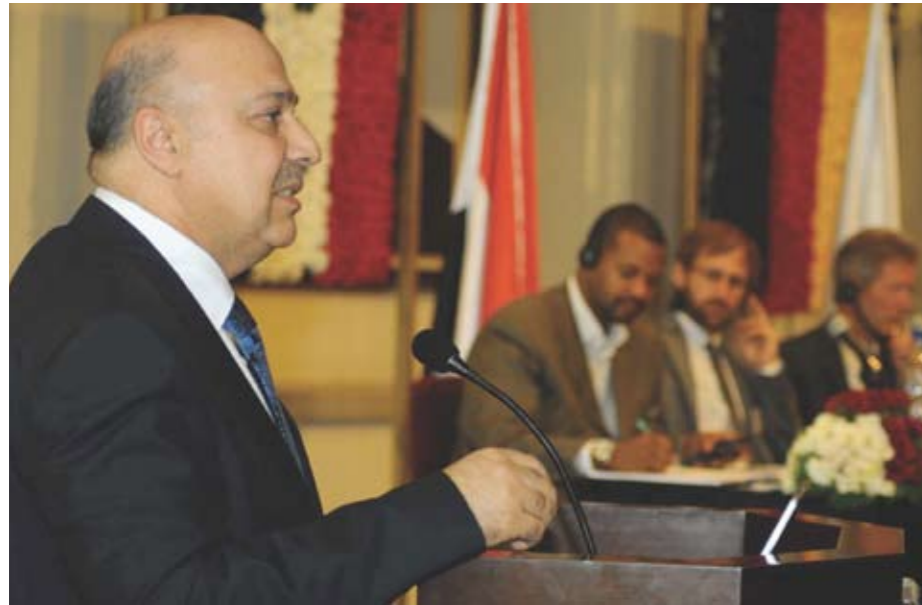
H.E. Minister Tamar Al Hajjeh bei der Städtekonferenz Syrien, 09/09

auf nationaler und kommunaler Ebene an verschiedenen Themen der Stadtentwicklung: In Aleppo stehen eine Stadtentwicklungsstrategie, Vorschläge zum Umgang mit informellen Siedlungen und die Fortführung der Altstadtsanierung auf der Agenda.